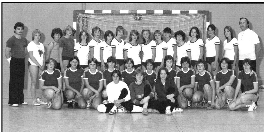
1977 Damen-Handball wird gegründet. Der vereinseigene Sportplatz wird an die Stadt verkauft. Die Handball-Abteilung begeh 50jähriges Bestehen.