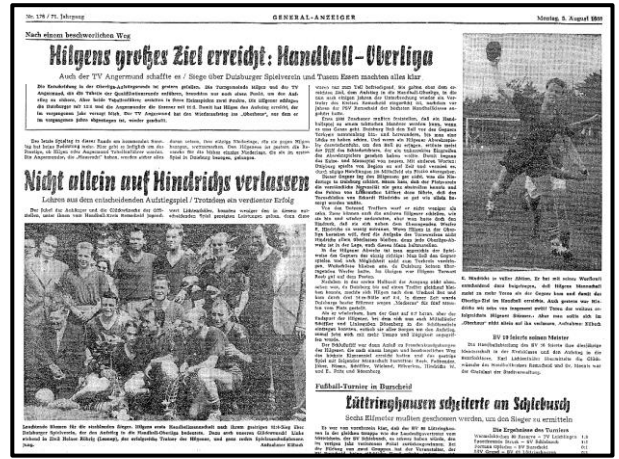
1959 Die I. Handballmannschaft steigt in die höchste deutsche Feldhandball-Spielklasse auf.