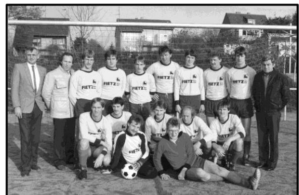
1968 Der Fußballverein Hilgen beantragt die Eingliederung in die Turngemeinde Hilgen und wird mit Wirkung 1. Januar 1969 als Abteilung aufgenommen.